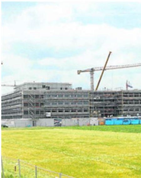
Bau des Bio Medical Center

Auf dem Campus Planegg-Martinsried entsteht derzeit der Neubau des Biomedizinischen Zentrums der Ludwig-Maximilians-Universität München (LMU). Der Neubau wird den nördlichen Abschluss des Campus bilden. Insgesamt umfasst das BMC vier Gebäudeteile, die sich um einen grünen Innenhof gruppieren werden