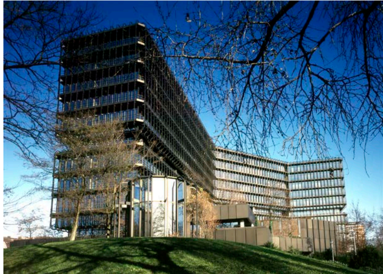
Europäisches Patentamt München

Die Arbeiten wurden unter Einhaltung strenger gesetzlicher Auflagen durchge-führt und vom Gewerbeaufsichtsamt, einem externen Sicherheits- und Ge-sundheitskoordinator sowie einem Gut-achter beaufsichtigt. Luftfilter in den einzelnen Sanierungsbereichen verhin-derten, dass bei den Arbeiten Staub nach innen entweichen bzw. aus dem Gebäude austreten konnte.